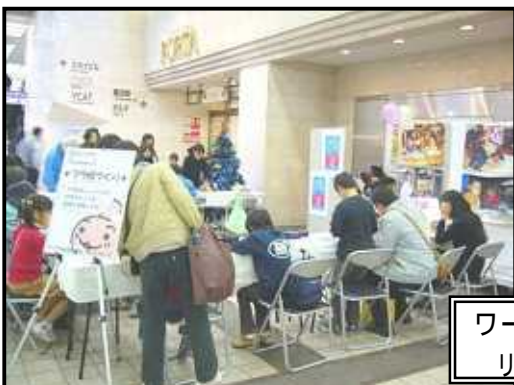
ワークショップで作られた、レッドリボンをつりに飾り付け!