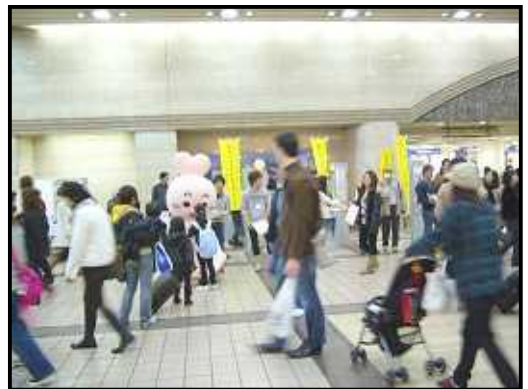
コムちゃんも頑張って イベントを宣伝!

その他には、ワークショップコーナーで、“AIDS ネットワーク横浜がレッドリボン作り”、“アジアの女性と子どもネットワークが、プラ板作り”を実施。どちらも大盛況でお客さんがやって来ました!