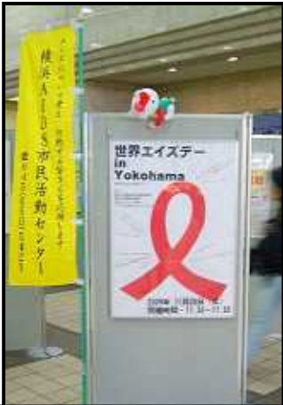
看板も設置OK! コムちゃんも準備万端!

協力: AIDSネットワーク横浜、アジアの女性と子供ネットワーク 神奈川県 健康増進課、神奈川県臨床衛生検査技師会