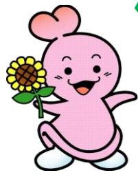
センターマスコット コムちゃん

あなたの人生の 主導権を持っている のは、あなた自身。 「同意」について 考えてみよう。