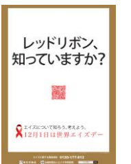
令和 3 年度世界エイズデーポスター

公益財団法人エイズ予防財団が世界エイズデーのポスターコンクールを実施します。 HIV 感染予防や HIV/エイズの理解と支援に関心のある方はもとより幅広くどなたでも参加できます。詳しい実施要領はこちら↓ https://api-net.jfap.or.jp/edification/aids/poster2022.html 応募締切:令和 4 年 9 月 5 日(月)(当日受付印有効)