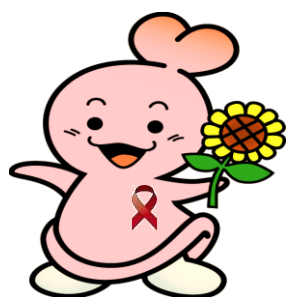
＜コムちゃんは横浜 AIDS 市民活動センターのマスコットです＞

日本での初めての感染 から30年以上が過ぎ 「HIV・エイズ」の治療は 大きく進歩しました。 昔の知識から最新の知 識をみんなで共有しま しょう。