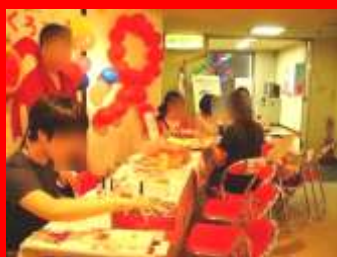
写真：2013年8月 イベント「AIDS文化フォーラムin横浜」(かながわ県民センター)