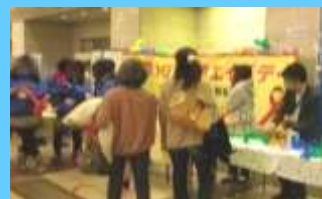
写真(下)：2013年11月 イベント「世界エイズデーin Yokohama」(新都市プラザ)